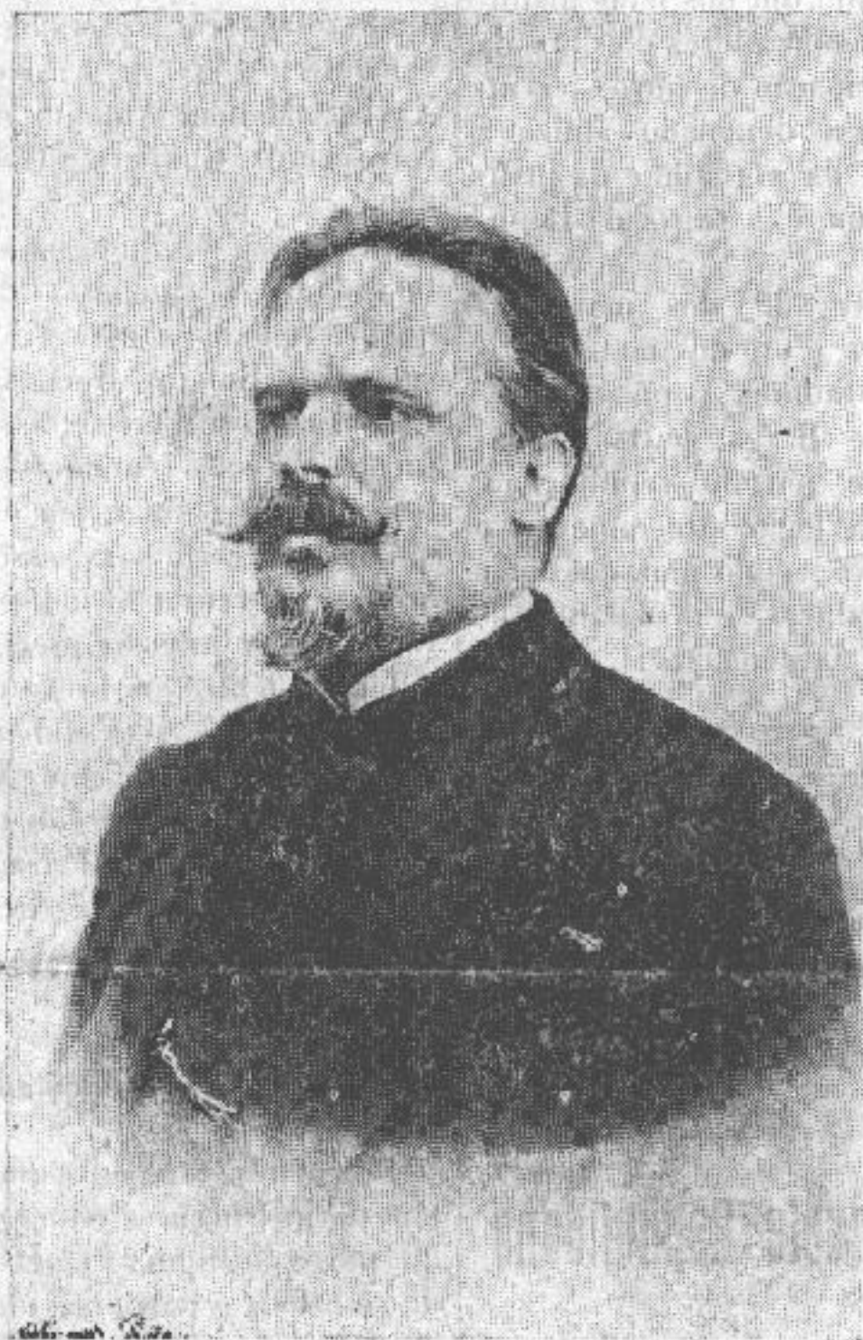
Dr. Antonio José de Almeida